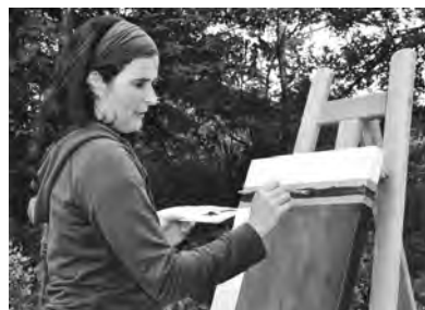
© ARTS et RIVES : l'artiste Julie Goulet