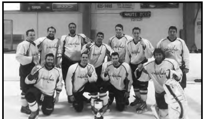
Gagnants de la division récréation : L'équipe de Saint-Léon