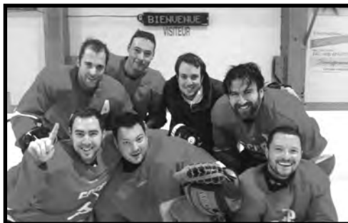
Gagnants de la classe C