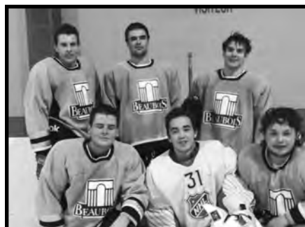
Gagnants de la classe D