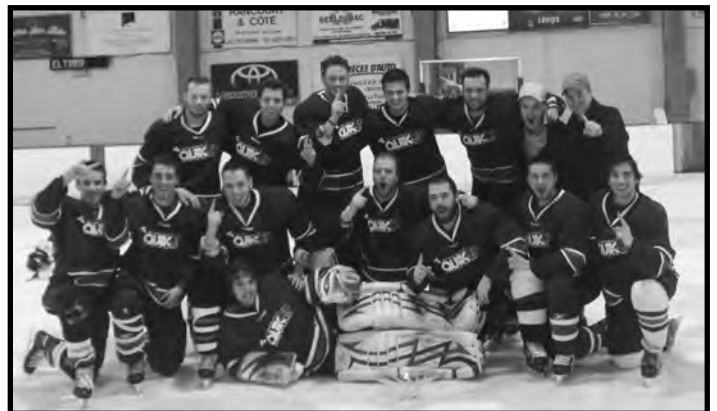
Gagnants de la division compétition : L'équipe du El Toro

À l'automne 2014, nous augmenterons le nombre d'équipes dans la classe C, nous rétablirons les règles dans les ligues et ce, dans le but de permettre à d'autres équipes et joueurs de venir s'amuser dans leur calibre.